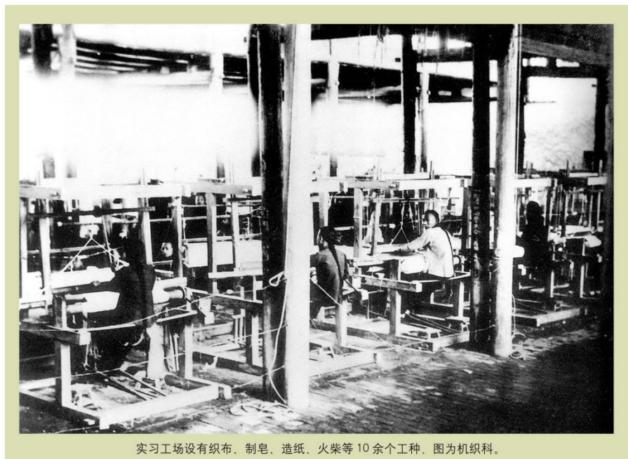
实习工场设有织布、制皂、造纸、火柴等 10 余个工种，图为机织科。

此时实习工场除供工业学堂学生试验制造，主要的是“以推广民间生计为主”，一方面进行商品生产，一方面为民间培养生产技匠，传播推广生产技能。学生当时的实习都是生产型实习，实习产品全部